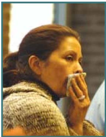
Het gerucht makend proces Biemans. "Het was een fluitje van een cent om binnen te breken in dat appartement."